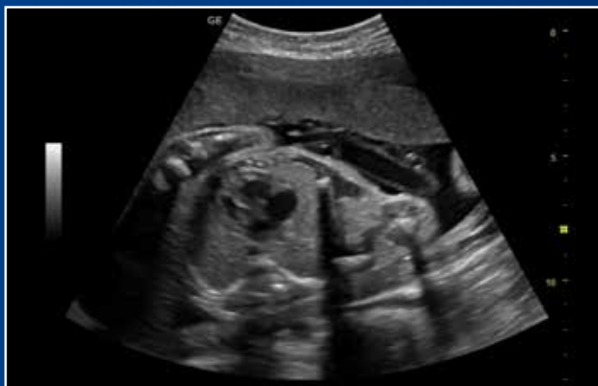
CrossXBeam™ e SRI-HD definiscono chiaramente i bordi delle strutture.